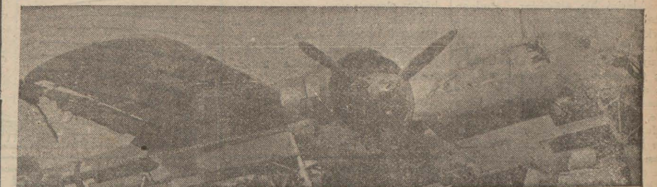
Londrayı bombardımandan dönen bir Alman tayyaresinin hali

Asliye 6 ncı hukuk mahkemesinde son derece garib bir davanın duruşmasına bakılmıştır. Davanın mev-