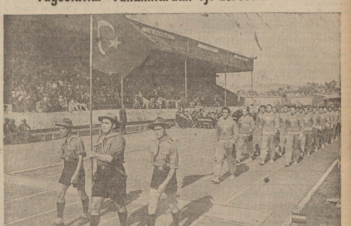
Dünkü merasimde Türk takımı geçerken

Bayrak yarışında, gülle atmada, 400 metrede birinci geldik, Yugoslavlar Yunanlılardan iyi dereceler aldılar